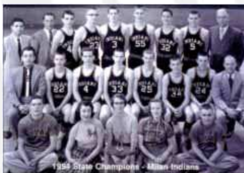
Milan Indians, los verdaderos Hoosiers

Ollie se ve obligado a jugar en la semifinal y sus tiros libres resultan claves para el desenlace del partido.